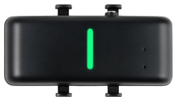
跟踪器主机及硅胶支架