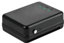
跟踪器主机及固定支架